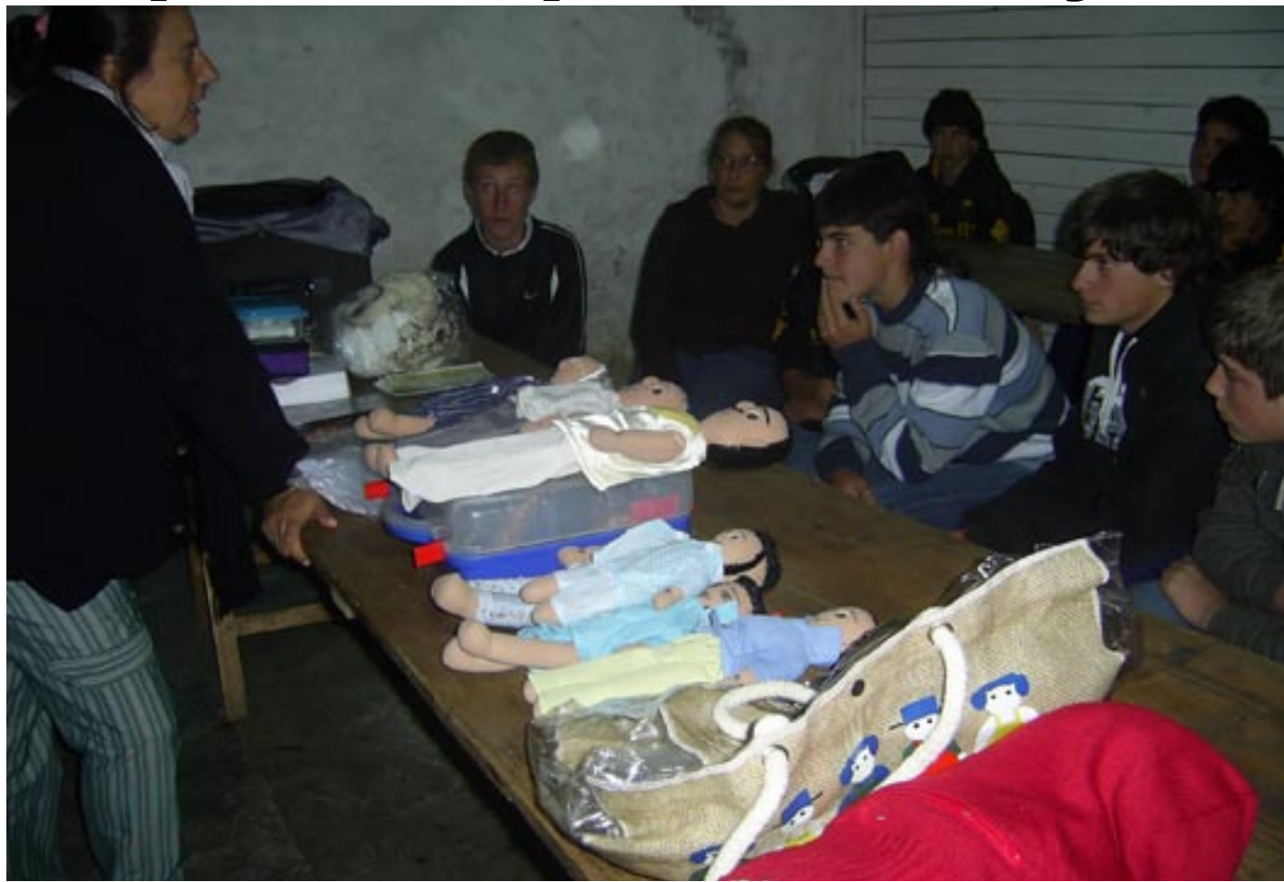
Club Progreso de Atlántida

Se realizó un curso de 15 hrs. compactando el anterior en razón de la demanda de los sindicatos, participaron 75 compañeros.