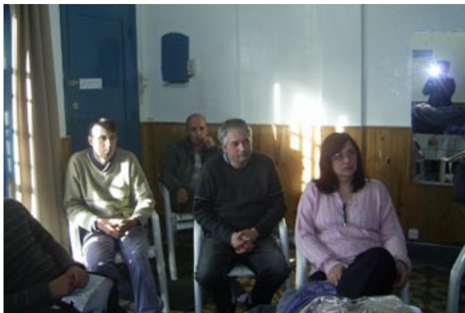
Taller con compañeros del Sindicato de la Química.

En nuestro país el Limite Higiénico de Exposición esta fijado en 85 dB(A)