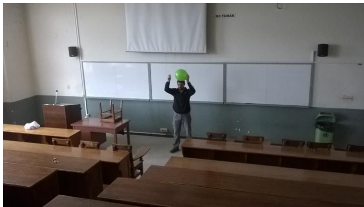
Figura 2. Medición del tiempo de reverberación

Al comienzo de la medición se grabó aproximadamente 1 minuto de ruido de fondo con el software libre AudaCity, registrando simultáneamente los niveles de presión sonora con el sonómetro. Luego se explotó un globo desde la zona en que el docente imparte su clase (Figura 2) y se continuó midiendo en silencio por unos 30 segundos más (Basso, 2015).