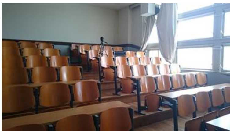
Figura 1. Equipos instalados en el salón 601.

Una vez verificada la calibración, se instalaron el sonómetro y el computador en un punto próximo al fondo del salón, procurando estar retirado al menos 1,5 metros de las paredes (Figura 1).