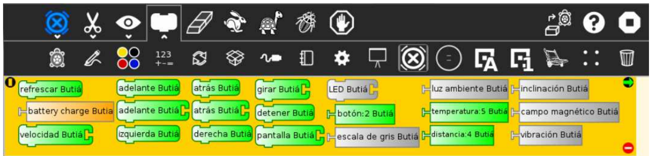
Figura 2: Paleta de programación en Turtle Blocks para trabajar con el robot Butiá