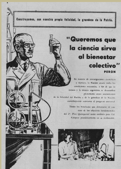
Revista Caras y caretas, 1953.