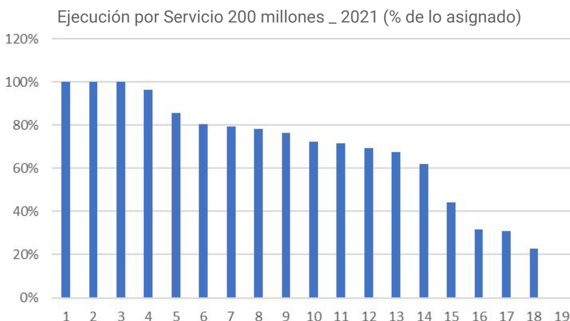
Gráfico 1. Porcentaje ejecutado por los Servicios Universitarios de la partida asignada para 2022

A la fecha, sólo tres Servicios ejecutaron el 100% de lo asignado, diez ejecutaron más del 60% y el resto ejecutó menos del 50% de lo que le fue asignado. El porcentaje de ejecución total es el 69% de los fondos.