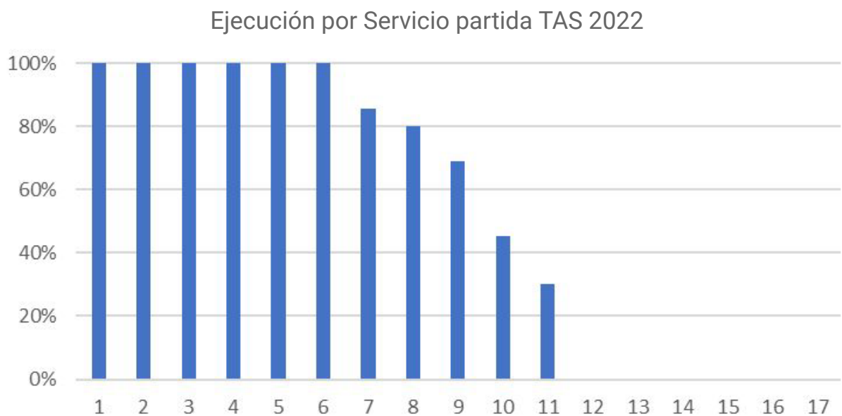
Gráfico 3. Porcentaje ejecutado por los Servicios Universitarios de la partida TAS

Menos de diez servicios han ejecutado fondos provenientes de la partida docente, mientras que de los once que han comenzado la ejecución de la partida TAS, son seis los que ejecutaron el 100%.